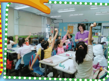
▲課堂中師生互動熱絡