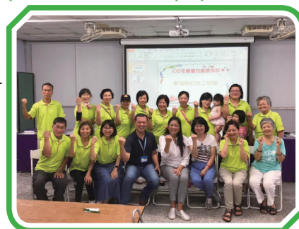
▲道安志工感恩茶敘