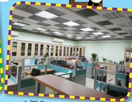
▲辦公室整修後整齊美觀