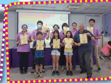
▲校長頒發服務及參與證書