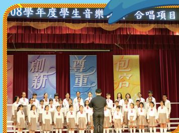
▲108 年度臺北市合唱比賽