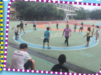
▲教室外的動態學習活動