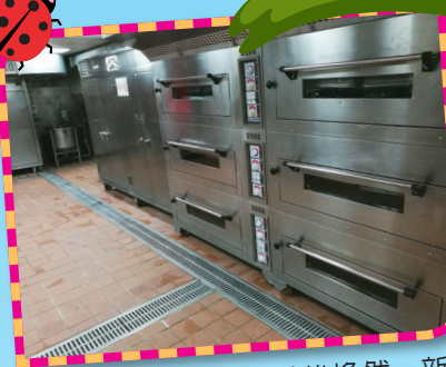
▲中央廚房地坪改善後煥然一新