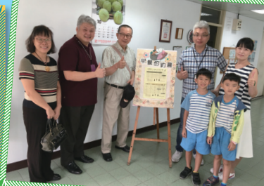
▲華夏社會公益協會 訪視兒童早餐