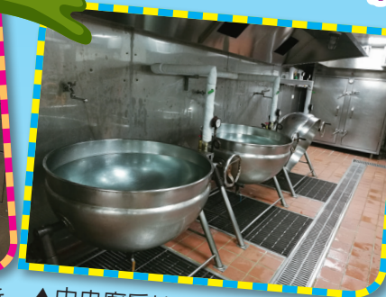
▲中央廚房地坪改善後整潔安全