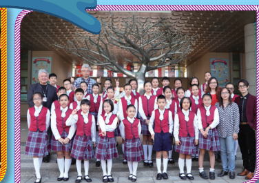
▲108 年度臺北市直笛比賽