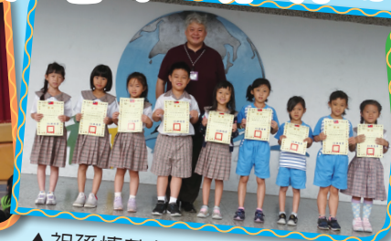
▲祖孫情著色比賽得獎同學合影