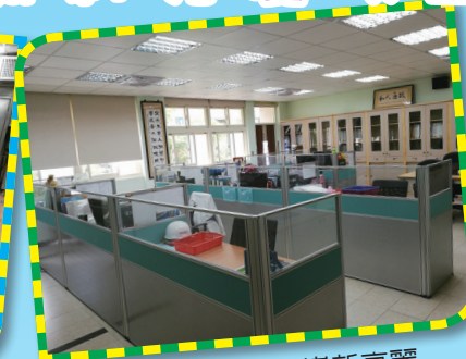
▲辦公室整修後嶄新亮麗