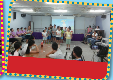
▲成果發表展現學習成果