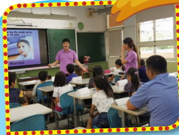
▲與志工老師相見歡