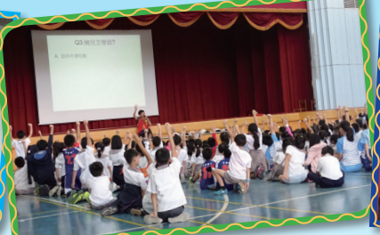
▲敬老長照宣導活動