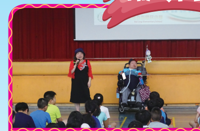
▲特殊教育宣導活動