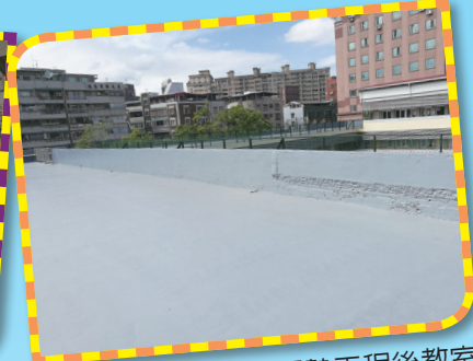
▲誠樸樓屋頂防水隔熱工程後教室 不漏水又隔熱