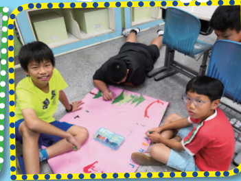
▲小組共同討論實作