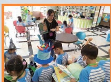
G1 故事角落到圖書館進行英語閱讀