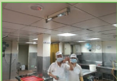
廚房加裝紫外線燈 環境衛生有夠讚!