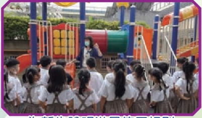
為新生說明遊具使用規則