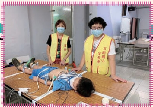
支援小一心臟檢查