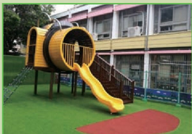
幼兒園遊戲場更新 色彩豐富又好玩!