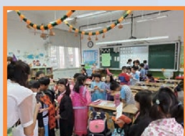
Trick or Treat 不給糖就搗蛋