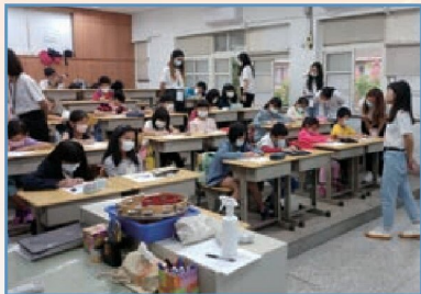
「我的新時代」週末營