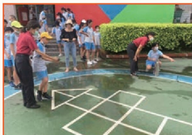
六年級防災體驗活動