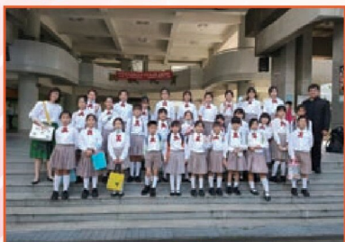
臺北市學生音樂比賽合唱團 榮獲優等