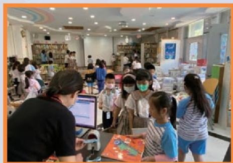
學童到圖書館借閱英語圖書