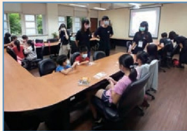
「亞提斯的神奇王國」 週末營