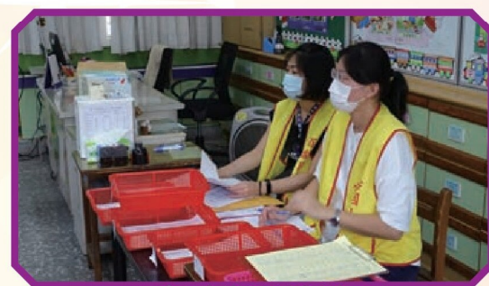
志工媽媽入班服務