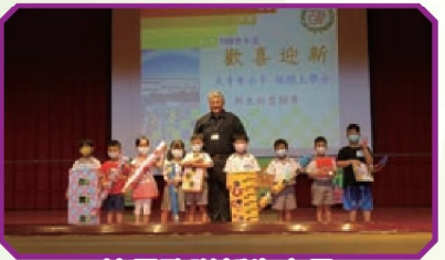
校長致贈新生文具