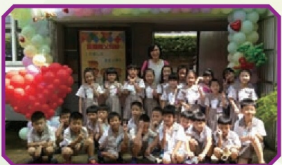
擺出最佳姿態讓爸媽為我們拍照