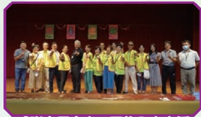
感謝家長會志工團的全力支援