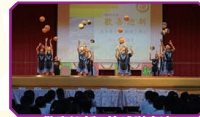
歡喜迎新 - 籃球隊表演