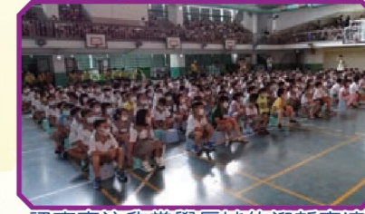
認真專注欣賞學長姊的迎新表演