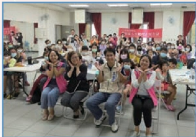
「發現家人互動的正向力量」 家庭展能活動