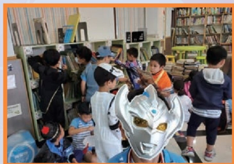
學童到圖書館進行英語閱讀活動