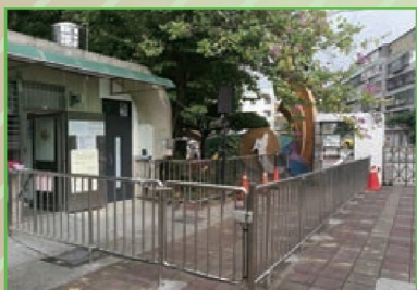
大門安裝護欄 親師生更安全!