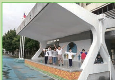
操場典禮台修繕油漆後 小朋友都說棒!