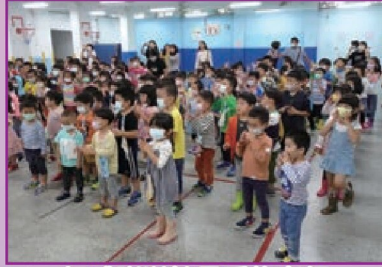
把感謝送給最愛的老師