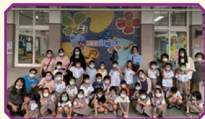
於校園美景前合影留念