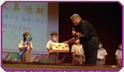
校長為新生說明各項文具的意涵