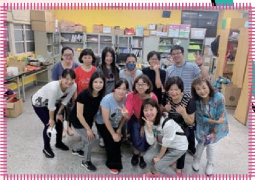
志工活動 - 手工皂DIY