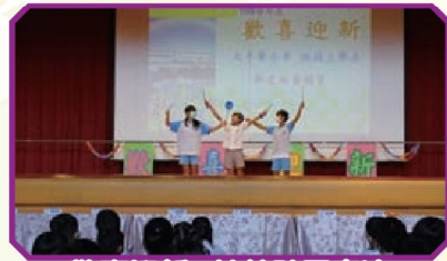
歡喜迎新 - 扯鈴社團表演