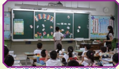
六年級導生為新生進行動作示範