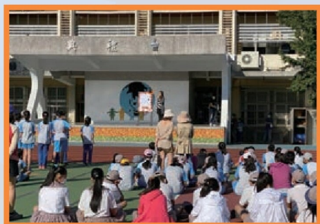
兒童朝會進行國際英語日及相關活動宣導

活動配合教學和生活體驗，鼓勵小朋友在課堂和課間的活動中自然接觸英語環境，進行英語情境式學習，期能讓百齡學童增進英語聽說的能力及自然接觸國際文化的機會，提升對英語學習的興趣和學力！