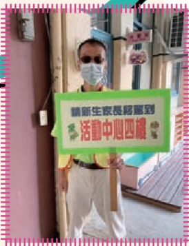
支援小一新生迎新活動