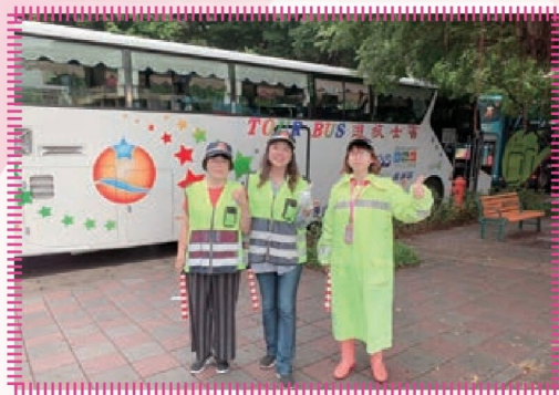
協助校外教學交管