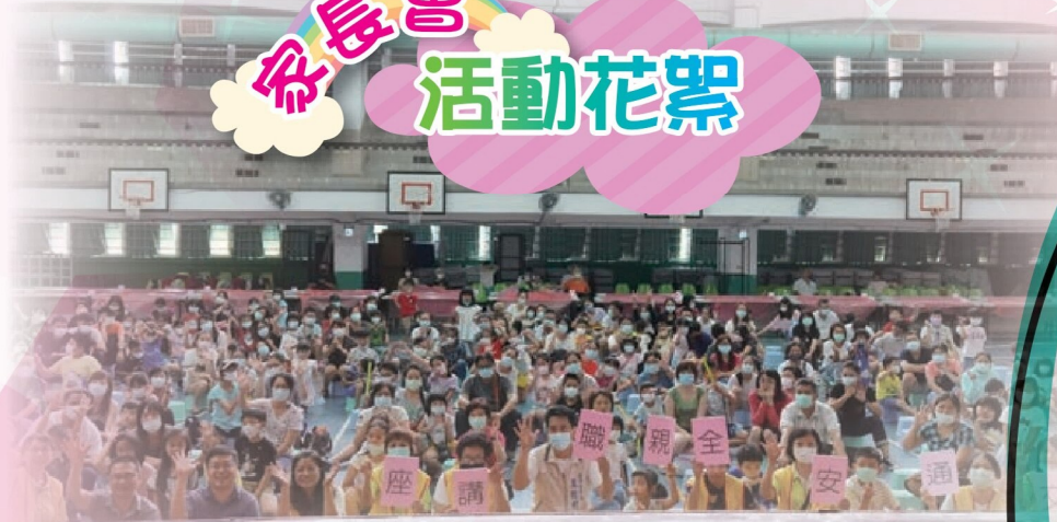
舉辦道安親職講座