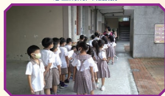
帶領新生參觀廁所環境