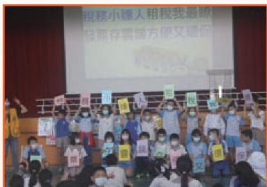
租稅教育宣導活動