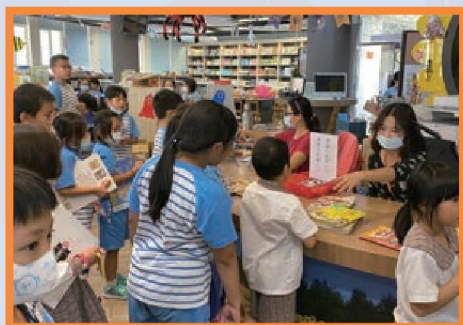
學童參加英語短語闖關活動