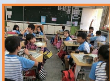
午間英語廣播 News LunchBox 陪伴學童用餐時間