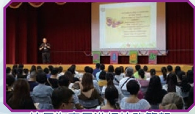
校長為家長進行校務簡報