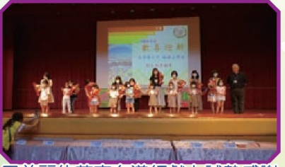
用美麗的花束向導師獻上誠摯感謝