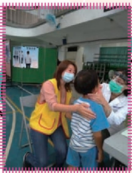
支援學生健康檢查