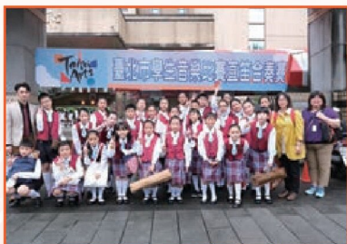
臺北市學生音樂比賽直笛團 榮獲優等第一名