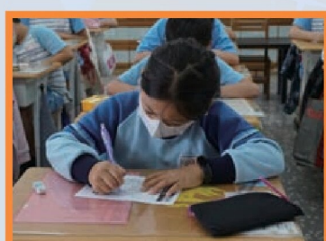
學習單練習闖關密語關鍵字