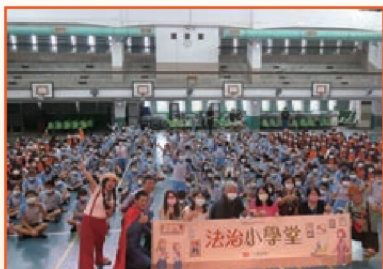
法治教育戲劇宣導—法治小學堂