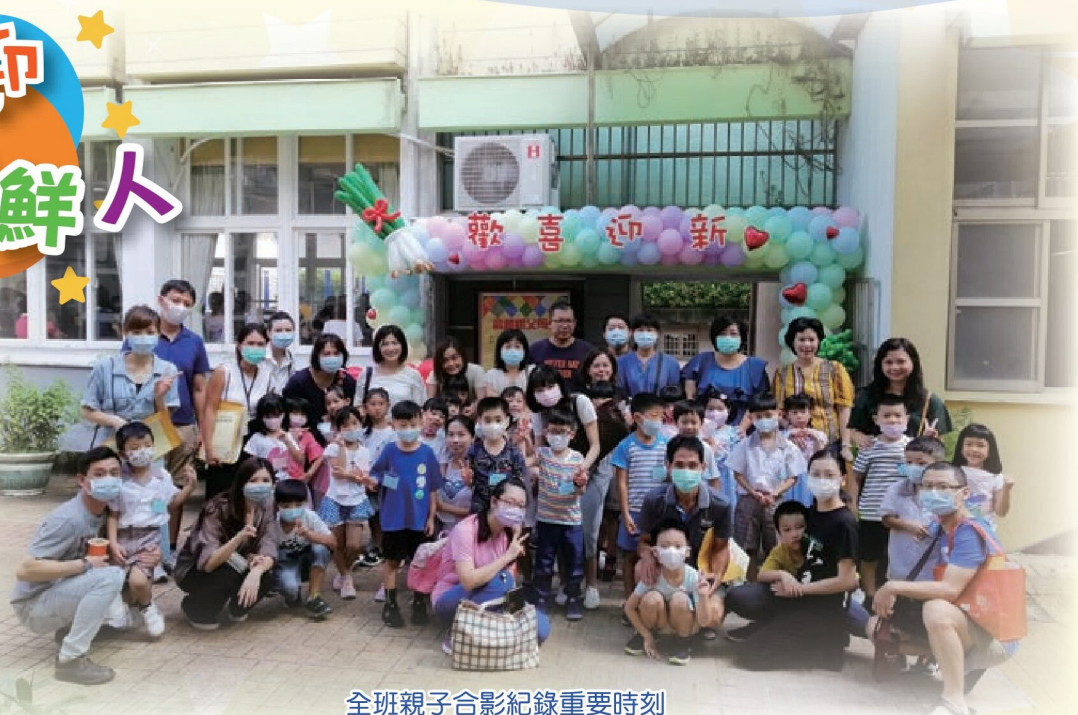
全班親子合影紀錄重要時刻