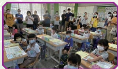
家長陪同新生一起聆聽導師的說明