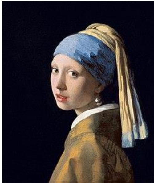
▲《戴珍珠耳環的少女》（約完成於 1665 年）

《戴珍珠耳環的少女》是 17 世紀荷蘭黃金時代畫家維梅爾（Jan Vermeer，1632 年~ 1675 年）的名畫。