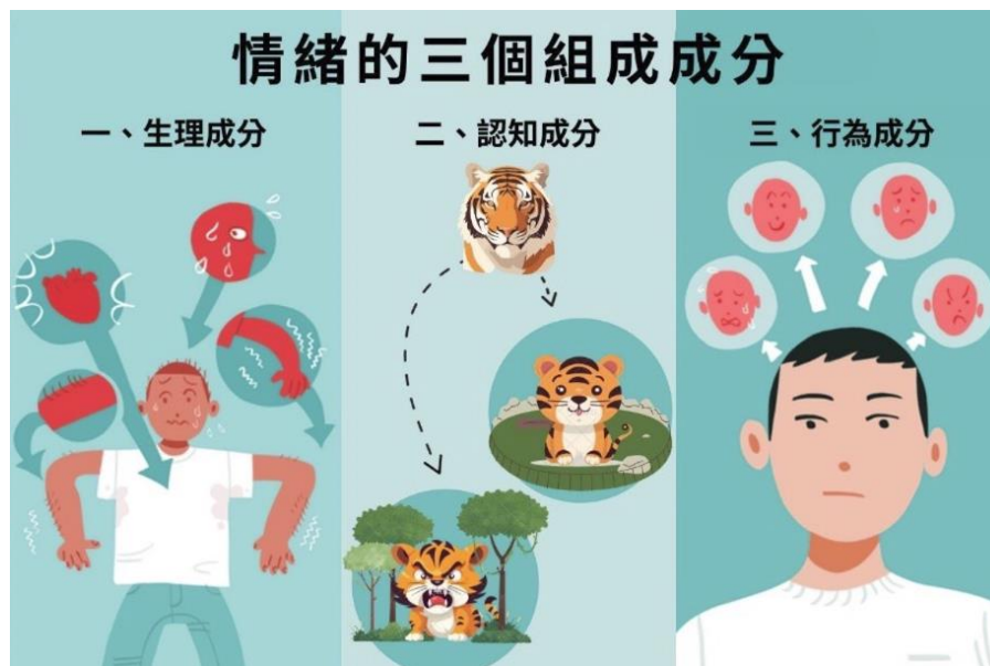
圖片說明：情緒的三個成分