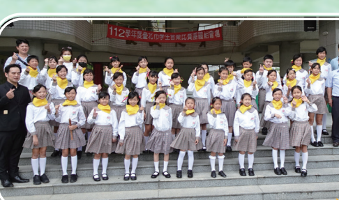
合唱團參加台北市音樂賽榮獲優等