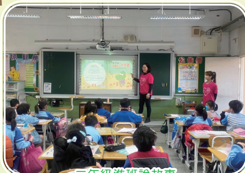
三年級進班說故事