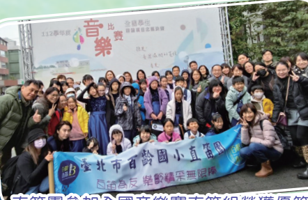
直笛團參加全國音樂賽直笛組榮獲優等