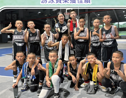
籃球隊參加全國國小秋季聯賽榮獲第四名