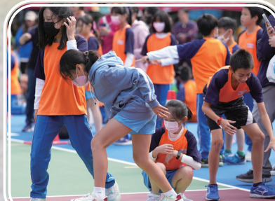
五年級趣味競賽同舟共濟