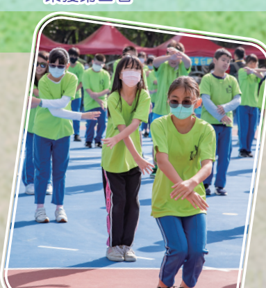
六年級活力滿滿健康操