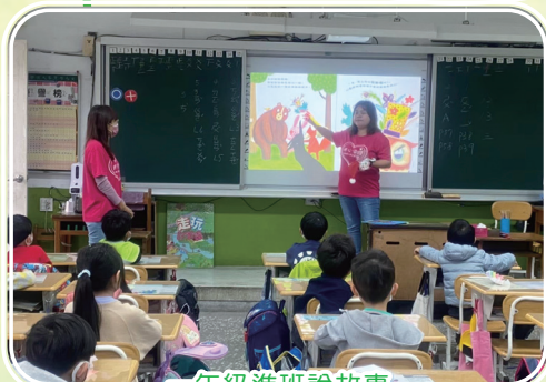
一年級進班說故事