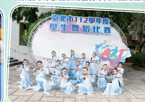
舞蹈團參加全國舞蹈比賽榮獲中年級組優等