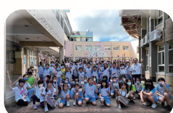
敬師活動敬謝師恩