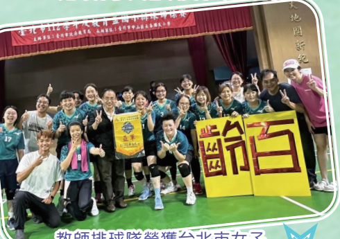
教師排球隊榮獲台北市女子教師組亞軍