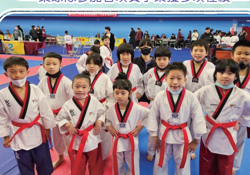
跆拳道隊參加台北市教育盃榮獲佳績