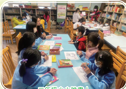
三年級小小說書人