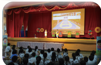
歡喜迎新快樂上學