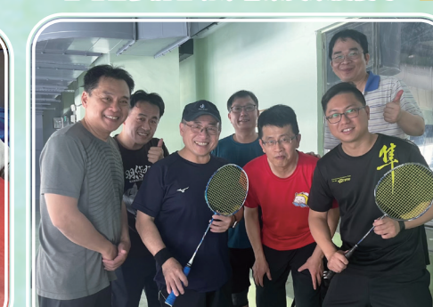
教師羽球隊參加教育盃羽球賽榮獲第五名