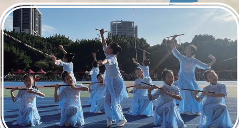
優雅開場舞-花兒俏笛聲巧