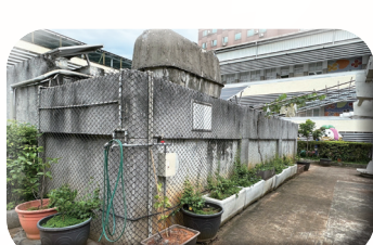
自動澆灌綠牆建置