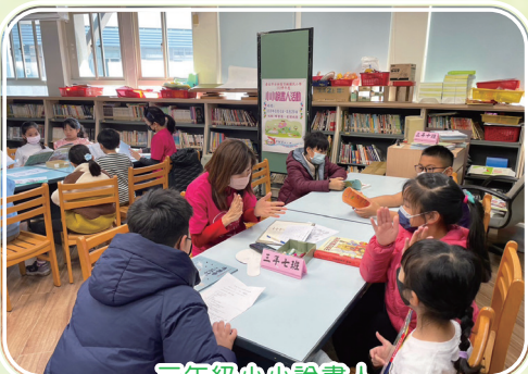
三年級小小說書人