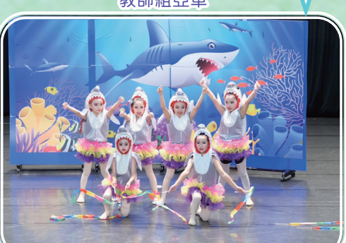
舞蹈團參加全國舞蹈比賽榮獲低年級組優等