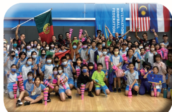
國際交流-葡萄牙合球國家隊