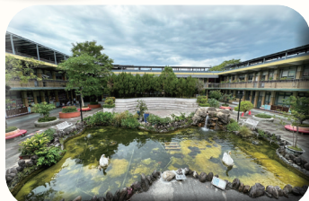
天鵝湖過濾系統整建