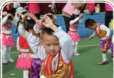
幼兒園-可可愛愛搖滾童年