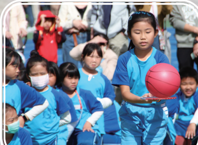
三年級活力十足-歡樂滿分