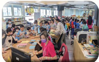
借閱搶頭香暨母語日