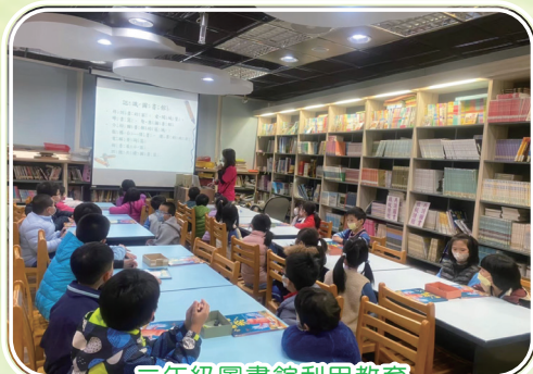
三年級圖書館利用教育