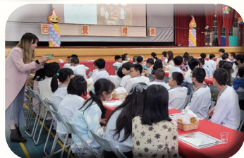
優雅端莊的六年級西餐禮儀活動