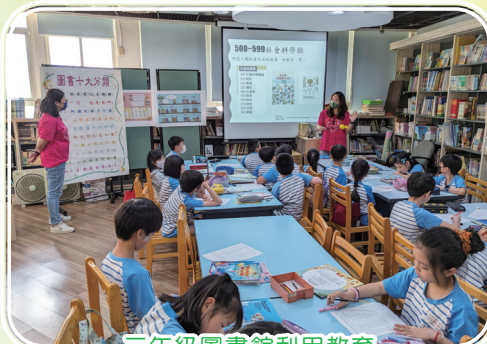
三年級圖書館利用教育