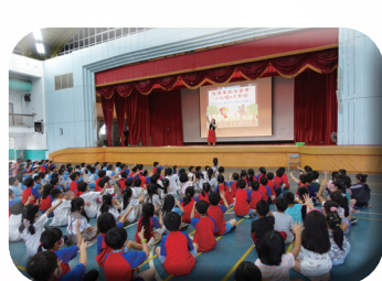
各項議題宣導學習