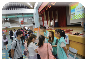
學校日升學博覽會