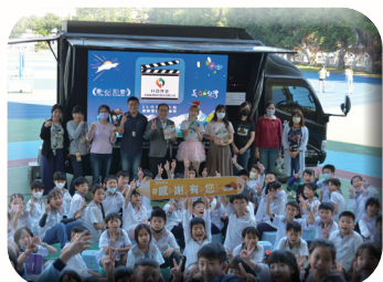
美力台灣3D行動電影院