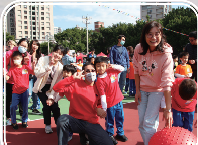
一年級歡樂滾大球