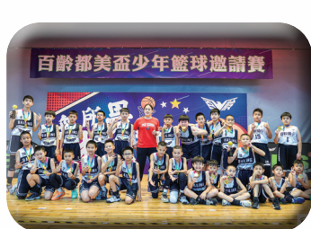
百齡盃籃球賽閉幕照