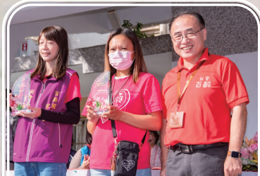
頒發優良道安志王獎