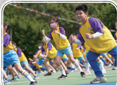
四年級熱舞百分百-歡樂齡距離