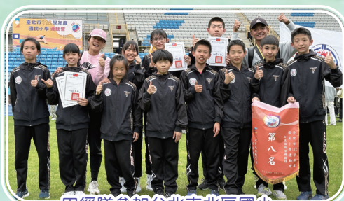
田徑隊參加台北市北區國小運動會榮獲多項佳績