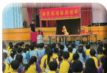
栩栩如生的傀儡戲四年級欣賞