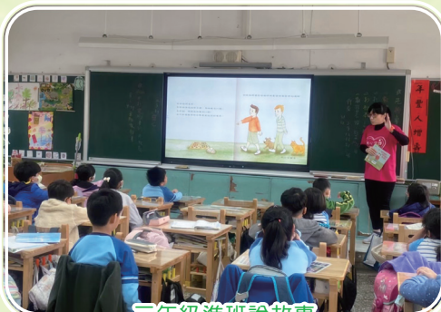
三年級進班說故事