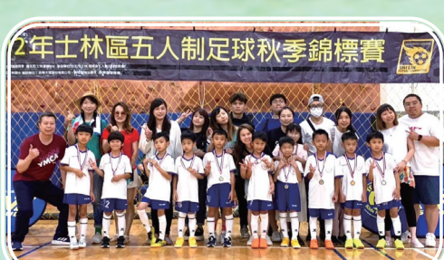
足球隊參與各項賽事榮獲佳績