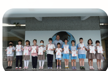
楷模學習頒獎表揚