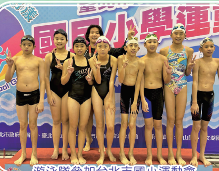
游泳隊參加台北市國小運動會游泳賽榮獲佳績