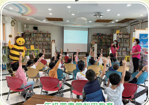
一年級圖書館利用教育