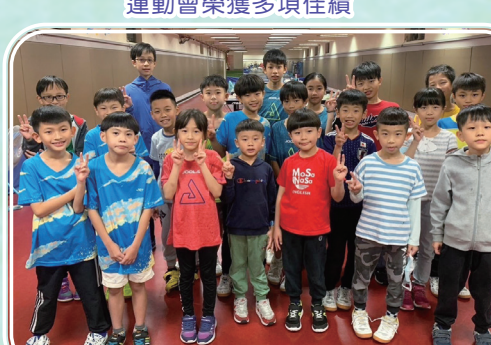
桌球隊參加各項賽事榮獲多項佳績