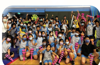
世界盃合球賽-中華台北合球隊