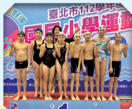
游泳隊參加台北市國小運動會游泳賽榮獲佳績