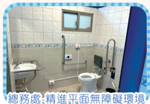
總務處-精進平面無障礙環境改善工程-無障礙廁所