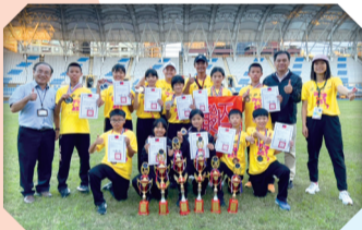
113田徑隊參加臺北市北區國小運動會榮獲多項佳績