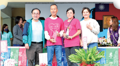
頒發113優良道安志工獎