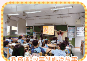
教務處-故事媽媽說故事