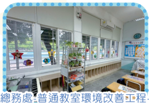
總務處-普通教室環境改善工程-書包櫃