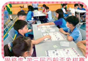
學務處-第三屆百齡盃象棋賽