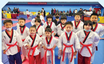
跆拳道隊參加台北市教育盃榮獲佳績