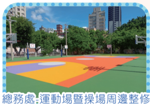
總務處-運動場暨操場周邊整修工程-籃球場