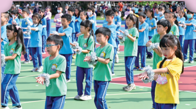
二年級七彩Rainbow-小城夏天