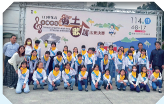
113合唱團參加全國歌謠賽榮獲優等