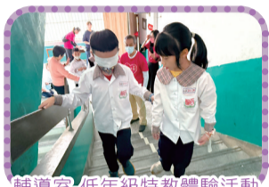
輔導室-低年級特教體驗活動