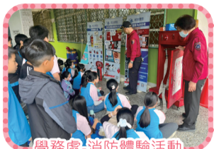
學務處-消防體驗活動