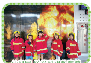
幼兒園-防災科學教育館