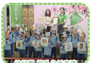
幼兒園-校外公益表演