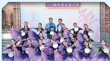
113舞蹈團參加全國舞蹈比賽榮獲中、年級組優等