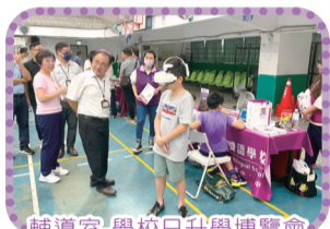
輔導室-學校日升學博覽會