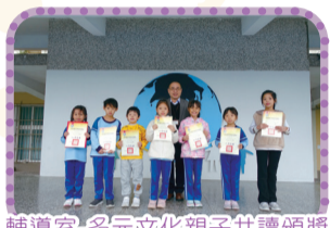
輔導室-多元文化親子共讀頒獎