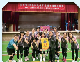
113教師排球隊榮獲台北市女子教師組亞軍