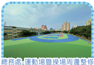
總務處-運動場暨操場周邊整修工程-操場周邊