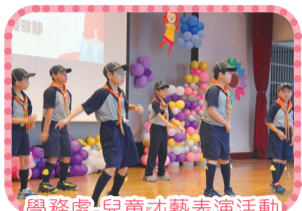
學務處-兒童才藝表演活動