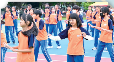
六年級健康活力健康操