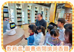
教務處-圖書借閱搶頭香暨世界母語日活動