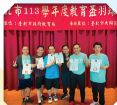
113教師羽球隊參加教育盃羽球賽榮獲第五名