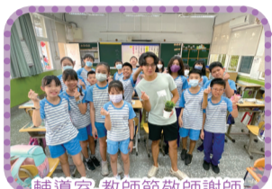
輔導室-教師節敬師謝師