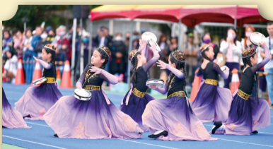
精彩開場舞-葡萄架下的月光