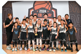
113籃球隊參加各項賽事榮獲佳績