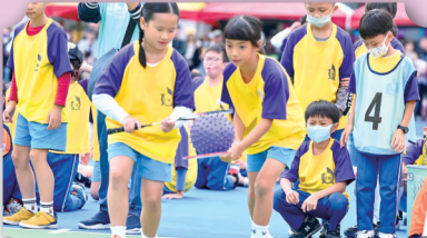
三年級同心協力夾夾樂