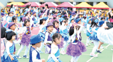
幼兒園和我一起打勾勾