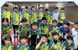
113桌球隊參加各項賽事榮獲多項佳績