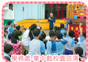
學務處-掌中戲校園巡演-武松打虎