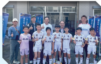
113足球隊參與各項賽事榮獲佳績