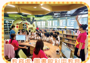
教務處-圖書館利用教育