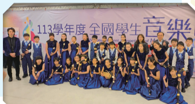
113直笛團參加全國音樂賽直笛組榮獲優等