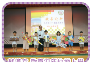
輔導室-歡迎新快樂上學