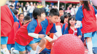
歡樂滾大球Go! Go! Go!