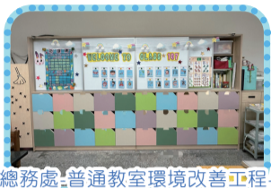
總務處-普通教室環境改善工程-學生置物櫃